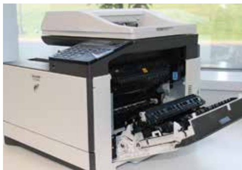
El acceso cómodo a la trayectoria del papel desde la puerta lateral facilita eliminar los atascos.