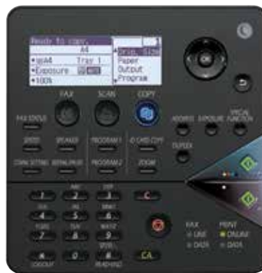
Panel de control del modelo MX-C300W