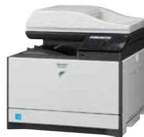
MX-C300W mostrado con bandeja para papel de 500 hojas (izquierda) y configuración estándar (derecha).