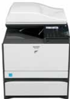
MX-C300W con MXCS11