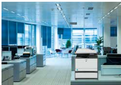
Compacto y potente para entornos de grupos de trabajo.