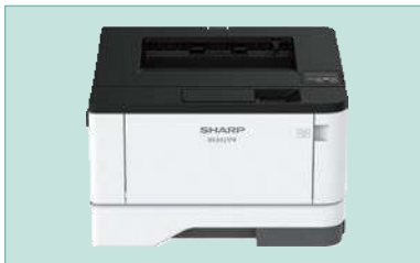
Configuración de escritorio estándar.