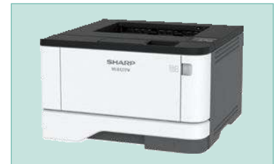
Conectividad inalámbrica incorporada.